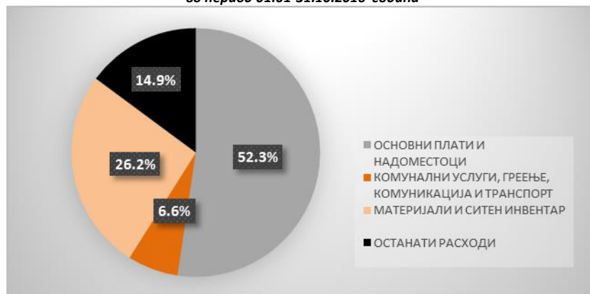
Графички приказ на структурата на реализирани расходи на ЈЗУ во период 01.01-31.10.2016 година